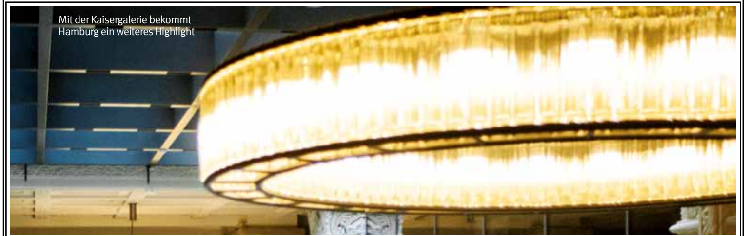
Mit der Kaisergalerie bekommt Hamburg ein weiteres Highlight